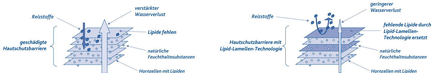
Schematische Darstellung einer geschädigten Hautschutzbarriere