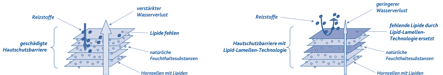
Schematische Darstellung einer geschädigten Hautschutzbarriere